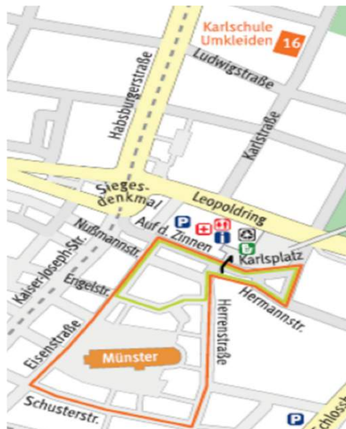
Figure 2 弗莱堡夜跑

https://www.facebook.com/groups/244173595983/