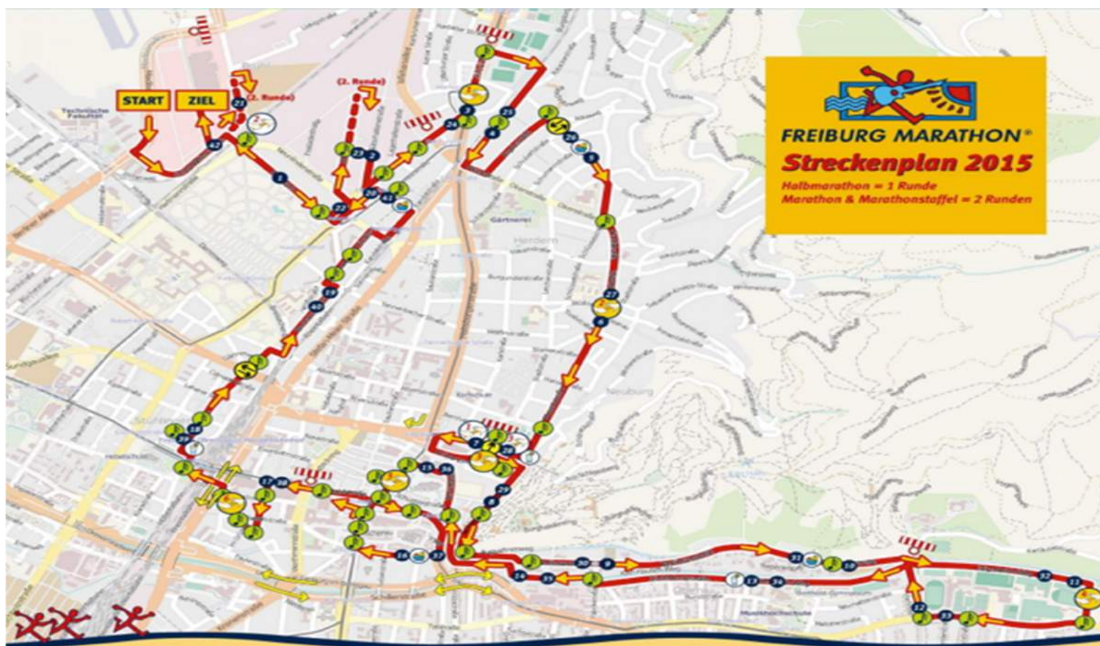
Figure 3 弗莱堡马拉松