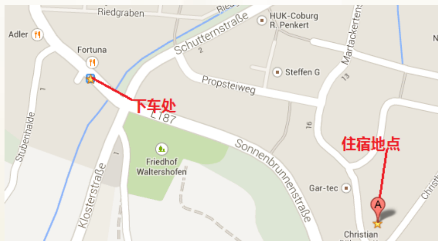
地藏七弗莱堡道场掠影