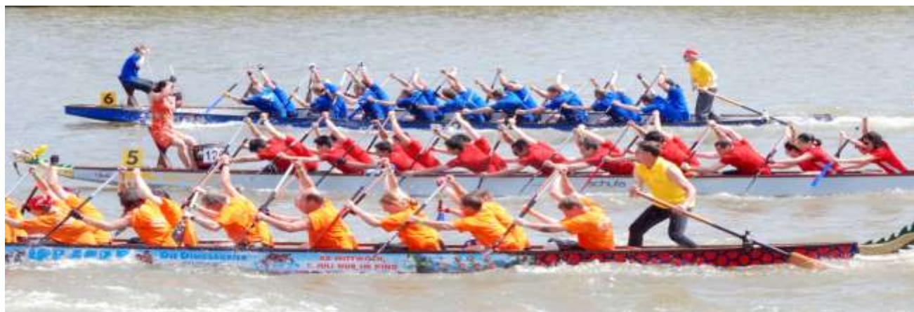
上图为 2009 年法兰克福举办的国际龙舟节

三节相逢来者众： 5 月底正是德国最美丽的初夏季节，风和日丽，鲜花怒放。除了中国文化节外，从 25 日到 27 日，在同一地点将举办“法兰克福国际龙舟节”。龙年龙舟赛，真乃是双喜临门。而且这个星期也是德国的 Pfingstfest（圣灵降临节），28 日周一也是节日。可以说，这是“三节同庆”。