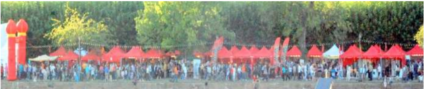
2009 年《华商报》主办的中国文化节热闹非凡，规模空前

艺术表演： 中国文化部将派出中国艺术家前来德国现场表演绘画、雕塑等艺术创作过程。法兰克福的友城广州市以及深圳市，均将前来参加，呈现他们的地域特色文化。届时，将搭建一个大型舞台，表演中国的歌舞、杂技、功夫、变脸、民乐、戏剧、时装秀、舞狮、腰鼓等文艺节目。