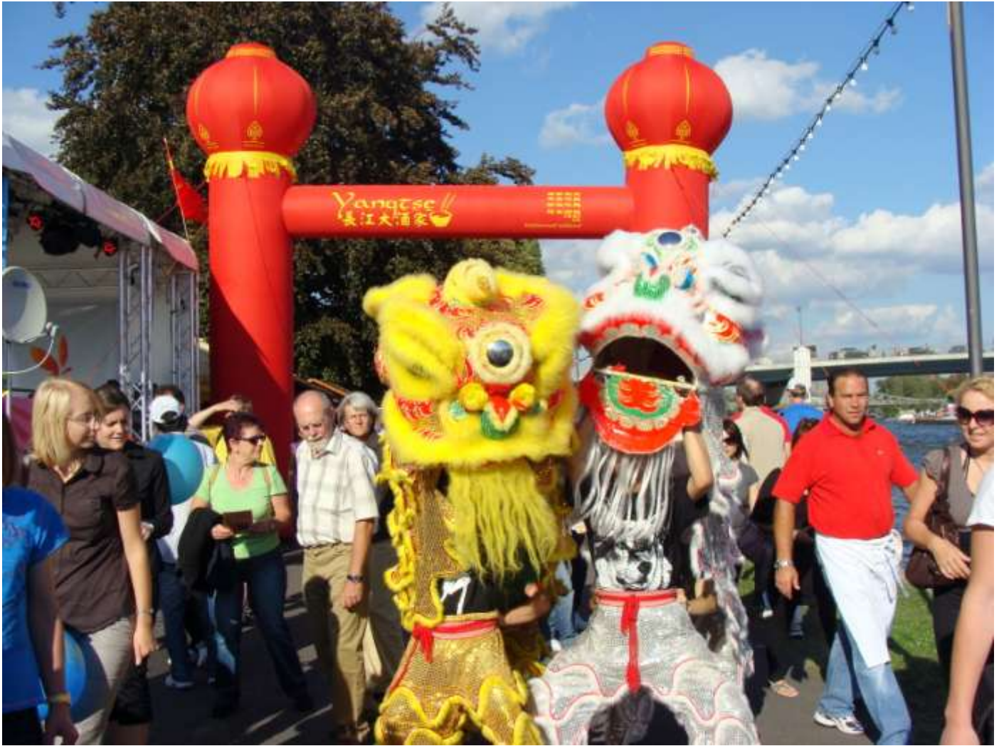
上图为 2009 年《华商报》在法兰克福举办的中国文化节场面