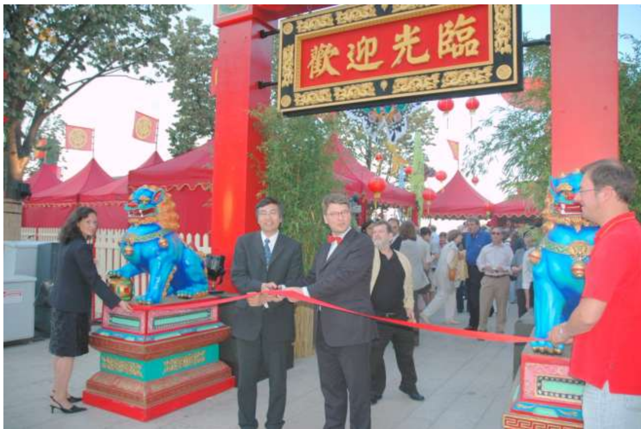
上图为本报主编与汉堡副市长为 2006 年在汉堡举办的中国节开幕剪彩

《华商报》主办： 法兰克福市政府再次委托《华商报》社主办此次中国市场。本报曾经多次举办大型的中国文化活动，特别是 2006 年 9 月参与组织了在汉堡的中国市场，2009 年 8 月主办了法兰克福河谷节上的中国市场，具有丰富的经验和广泛的合作关系，能够胜任此一任务。