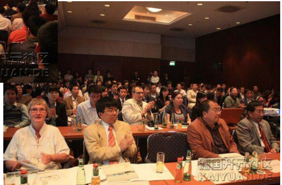
09姑苏创业领军人才计划推介会